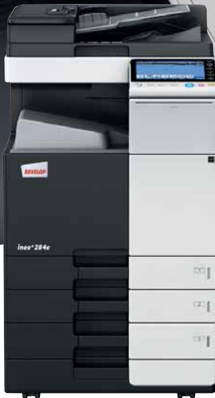
ineo+ 284e mit Papierkassette (PC-210) und Dual Scan Originalinzug (DF-701)