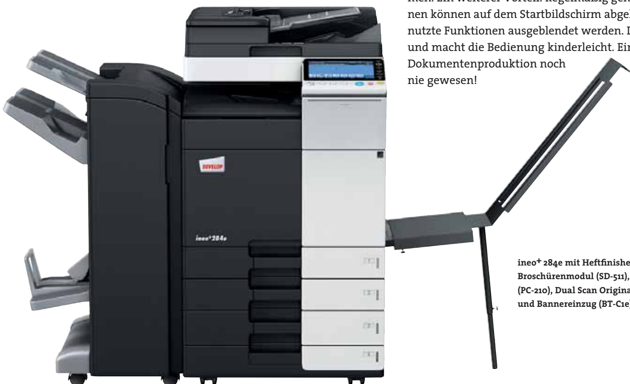
ineo+ 284e mit Heftfinisher (FS-534), Broschürenmodul (SD-511), Papierkassette (PC-210), Dual Scan Originaleinzug (DF-701) und Bannereinzug (BT-C1e)

Viele Multifunktionssysteme sind alles andere als anwenderfreundlich. Doch damit ist nun Schluss – die ineo+ 284e ist für Ihre Anforderungen wie geschaffen. Das Bedienungskonzept ist intuitiv erfassbar und genauso leicht verständlich wie das eines Smartphones oder Tablet-PCs. Der kapazitive 9 Zoll-Touchscreen verfügt über vertraute Funktionen wie flick, drag&drop und pinch in&out, sodass die Bedienbarkeit ganz einfach ist. Und dank der neuen Menüstruktur lassen sich alle Funktionen auf einen Blick erfassen und die gewünschten Einstellungen mit nur wenigen Berührungen vornehmen. Ein weiterer Vorteil: Regelmäßig genutzte Funktionen können auf dem Startbildschirm abgelegt, ungenutzte Funktionen ausgeblendet werden. Das spart Zeit und macht die Bedienung kinderleicht. Einfacher ist Dokumentenproduktion noch nie gewesen!